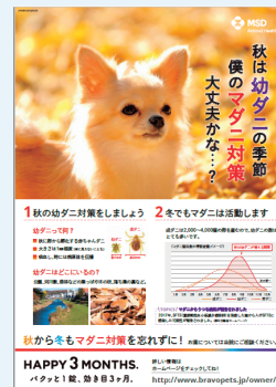
図1 秋のマダニ対策啓発用ポスターの例