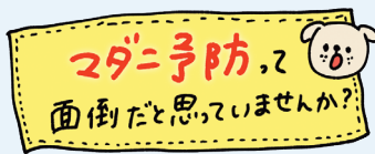
図1のポスターには「秋の幼ダニ対策をしましょう」と記載されていますが、「え? 秋は幼ダニ対策が必要なの?」と、飼い主さん視点の言葉に変えてキャッチコピーにするのも手です。

まずはキャッチコピーで瞬時に興味を引きましょう。「ご存知ですか?」「SFTSって何?」などの問いかけや、「知らなかったでは済まされない!〇〇の話」「これからの季節は要注意!」など、インパクトのある言葉が効果的です。